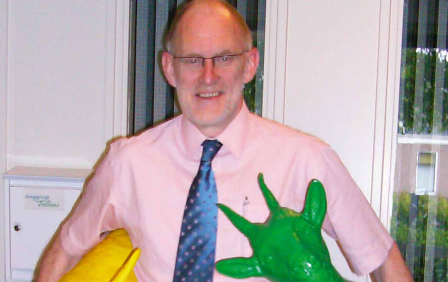
"Die kan ik gelijk voor destructie aanbieden"