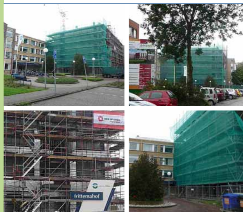
De contouren van het nieuwe gebouw worden al zichtbaar.