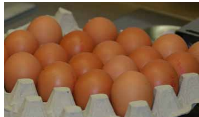
Nu ook 's avonds lekker eten in Makkum.