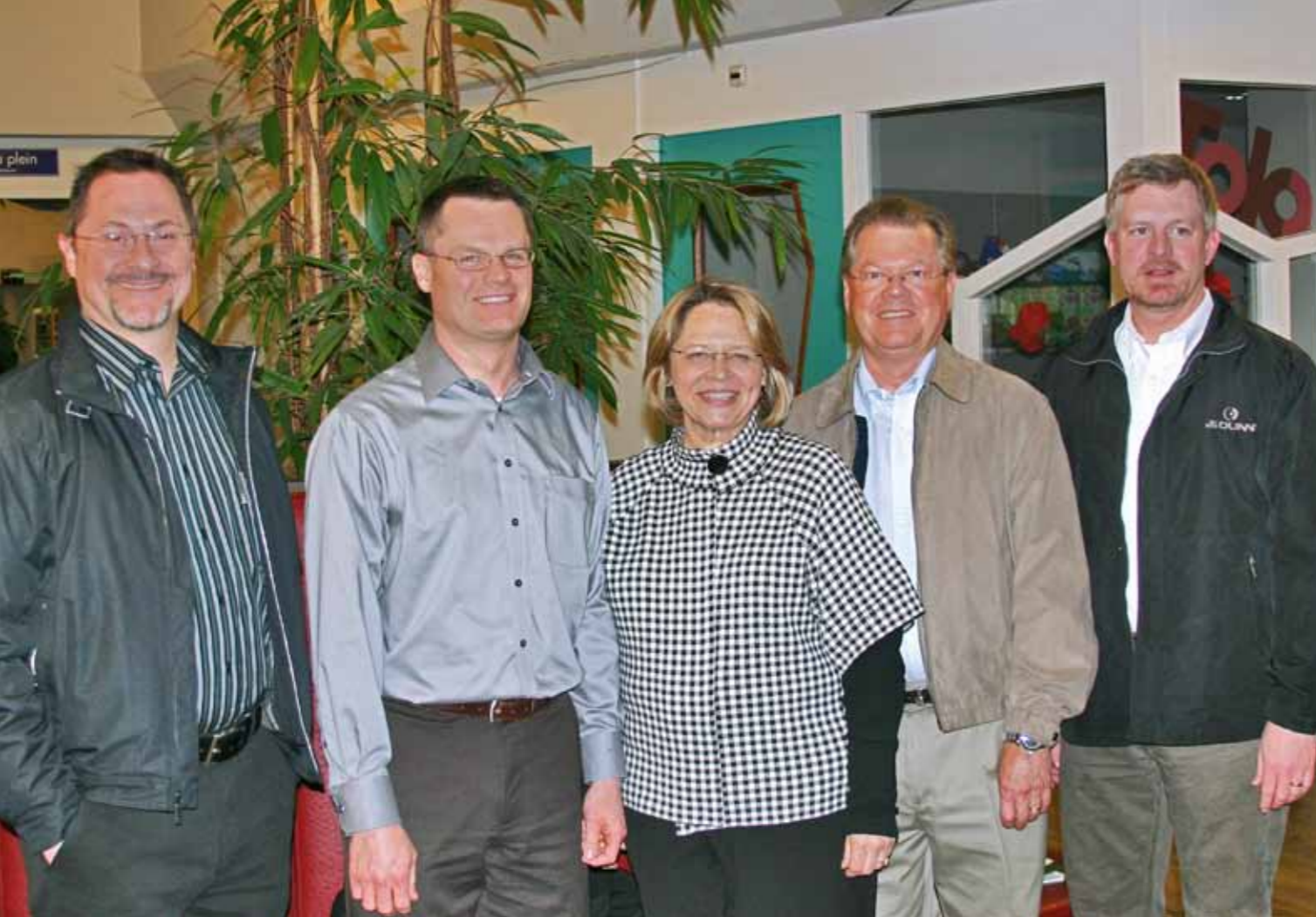
Bezoekers van Gerti uit Kansas, Amerika.