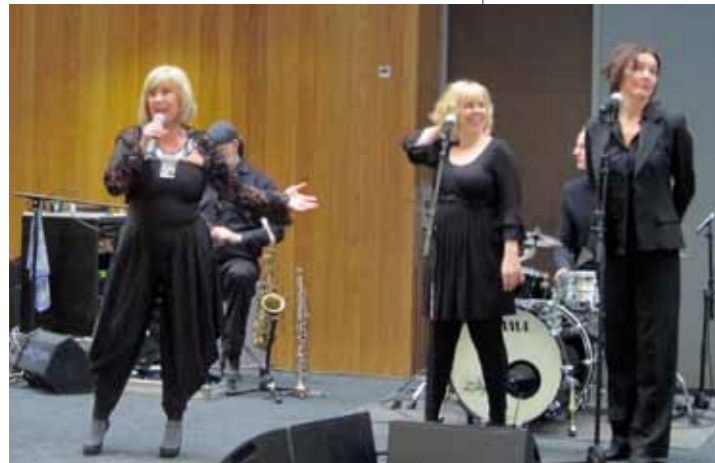
Willeke Alberti zingt bewoners in Workum toe.