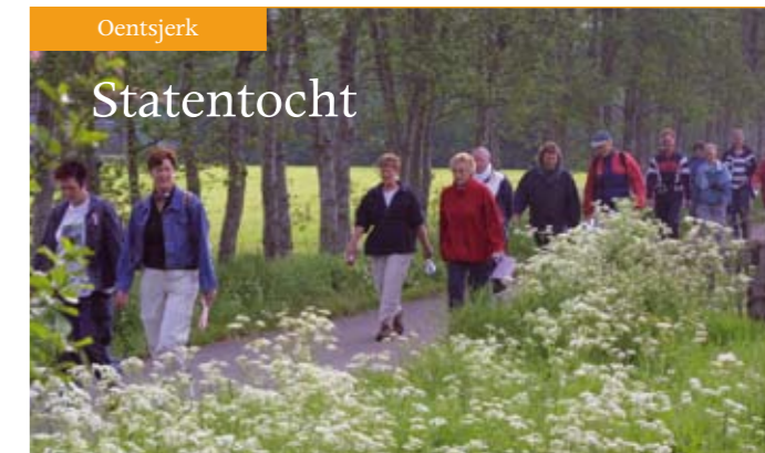
Zaterdag 15 mei stonden Skewiel en omgeving in het teken van de jaarlijkse Statentocht, een loop-/wandeltocht voor iedereen met 'in grut ferskaat' aan afstanden, van 2,5 tot 35 kilometer. De deelnemers konden genieten van het prille groen, het majestoeuze 'smûk skaadzjend beamtegrien', ooit bezongen door de Friese dichter Harmen Sytstra, maar ook vergezichten over de uitgestrekte groene weiden richting de Waddenzee. En dat alles met onderweg de oude zathes en states waar de tocht zijn naam aan ontleent.