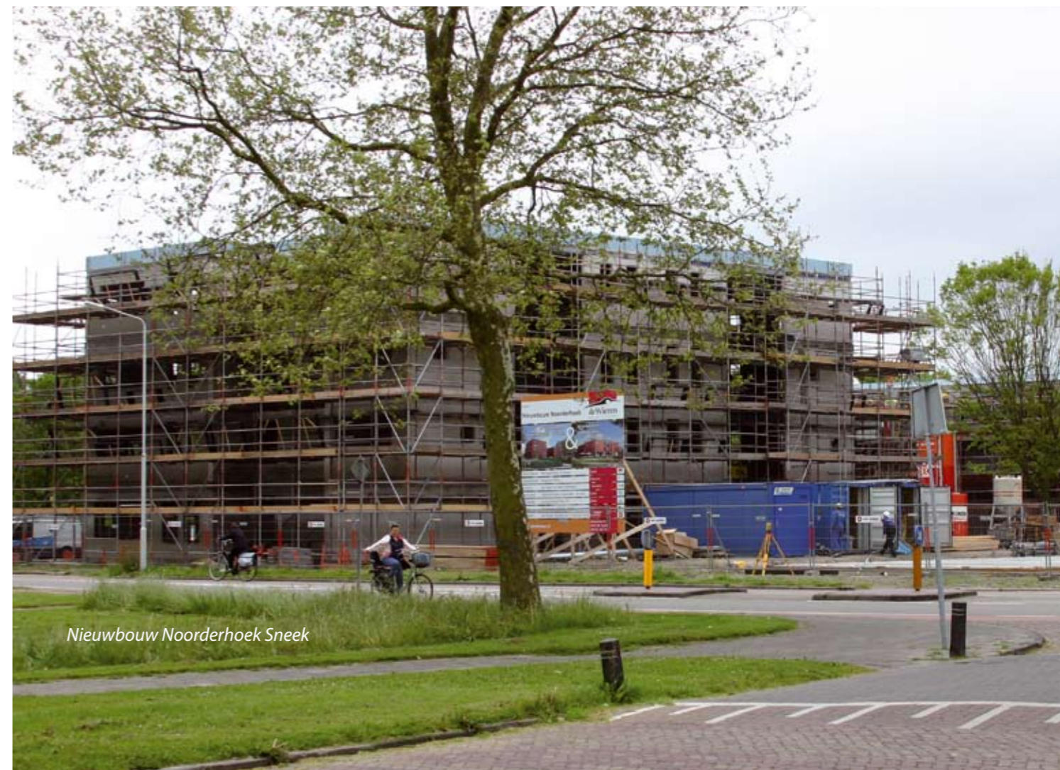
Nieuwbouw Noorderhoek Sneek

In Aylva State wordt hard aan de nieuwbouwvleugel gewerkt. De fundering ligt er al een tijdje in, een groot deel van de wanden en vloeren staat al. De toekomstige vorm van het gebouw wordt al goed zichtbaar.