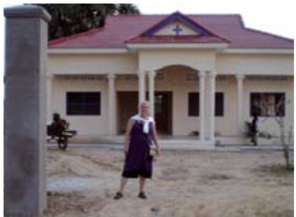
Verlag | Sjoeke Bijlsma (Nij Dekama)

Om te beginnen had ik een goede periode uitgekozen om weg te gaan want in Fryslân sneeuwde het wekenlang en in Cambodja was de gemiddelde temperatuur 35 graden Celsius. Door de week verbleef ik op het platteland in het dorpje Chukk. Ik woonde daar met andere vrijwilligers in een Khmer-hut, een "huis" op palen van hout en riet. De dag begon voor ons om 6:45 uur: hout sprokkelen en hakken, water uit de waterpomp filteren, vuurtje stoken op onze kookpot waar we het water op kookten voor ons eten en drinken, bananenplanten