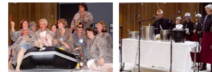
Maandagavond 7 juni startte in Nij Mariënacker de opening van de vakantieweek. Alle teams (keuken, huishouding, zorg intramuraal, zorg extramuraal, welzijn en management) deden een act. Bewoners hebben geweldig genoten!