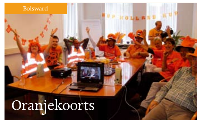
De Oranjekoorts is ook bij Tellens toegeslagen. Collega's van het Centraal Bureau zijn in WK-voetbalstemming.