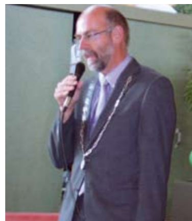
Burgemeester Theunis R. Piersma

“Dit jaar brengen we de vakantie bij u thuis. U kunt zich op vakantie wanen zonder een koffer te hoeven inpakken en zonder een voet in de bus, trein of vliegtuig te hoeven zetten.” De activiteitenbegeleiding bedacht een vakantieweek in eigen huis met als thema “Ut en thús yn ..... Italië”.