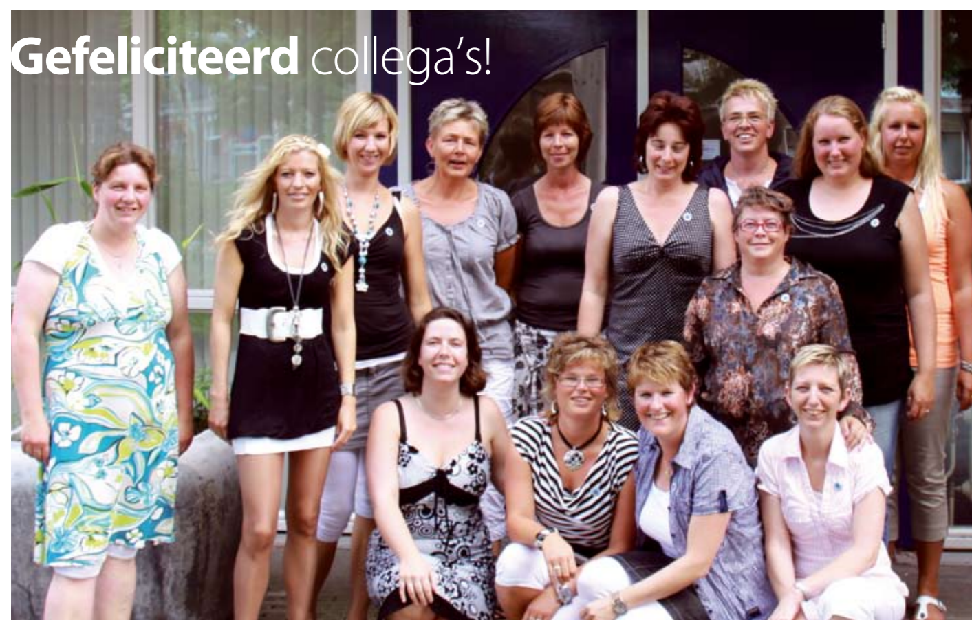
Op 29 juni jl. was de diploma-uitreiking van alweer de elfde groep verzorgenden, allemaal geslaagd voor hun EVV-diploma.