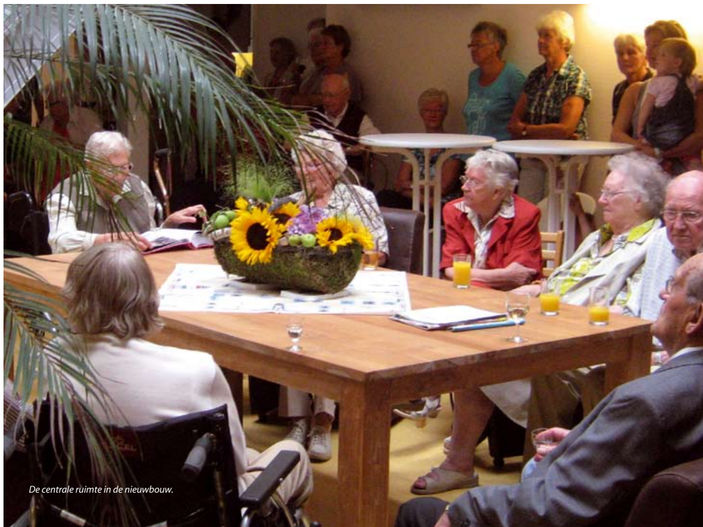
De centrale ruimte in de nieuwbouw.