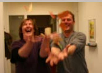
De financiële commissie